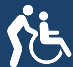
spécialistes agricoles diplômés

La majorité des étudiants étrangers à Chatham-Kent ont l'intention de demander la résidence permanente au Canada.