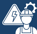
technique en génie électrique