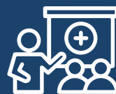
assistant en ergothérapie/ physiothérapie