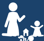
éducation à la petite enfance